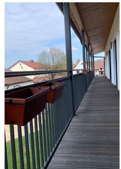
Balkonbepflanzung steht in den Startlöchern

Diese Idee ist nicht nur ein optisches Highlight, sondern auch eine pädagogisch wertvolle Aufgabe indem man den Jungen und Mädchen die Pflege der Pflanzen näherbringt und anvertraut – auch die gesunde und richtige Ernährung wird hier erklärt und gelebt. Das pädagogische Fachpersonal war von diesen Ideen im großen Teammeeting überzeugt und gab das Go für dieses Projekt.