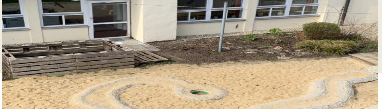
Der Hortgarten bekommt ein Frühlingsgesicht

Der Baukran ist verschwunden, das ist ein Signal das die Bauarbeiten am Hortgebäude zügig voranschreiten. Die Verputzungs-Arbeiten sind geschafft und die Fußbodenheizung wurde verlegt. Die Jungen und Mädchen beobachten jeden Tag neue Veränderungen, somit nimmt unser Anbau täglich an Gestalt zu.